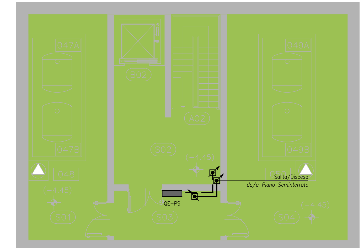
PIANTA PIANO SEMINTERRATO